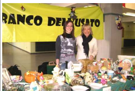
La nostra Presidente e una studentessa volontaria ai mercatini solidali di Natale

L'informa-genitori www.genitoricasiraghi.org