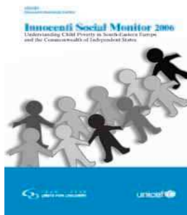
Copertina del rapporto Social Monitor 2006

stare la povertà e le ineguaglianze tra i bambini si devono urgentemente stanziare risorse economiche e adottare politiche dirette all'infanzia».